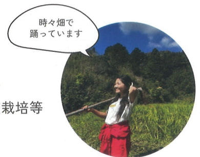
時々畑で 踊っています