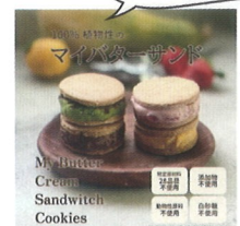
育てた作物で スイーツ作ってます

農業に携わって思うのが「農作業は好きだけど、生業にするのは難しい」ということです。(私も獣害に何度も合いました) 地域の農産物を使った商品開発をすることやSNS発信を通じて、大山や大山の農業のことを市外の方に知っていただくことで地域に貢献していきたいと思っています。どうぞよろしくお願いたします。