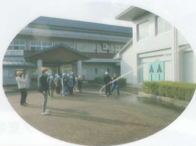
屋内消火栓の放水体験