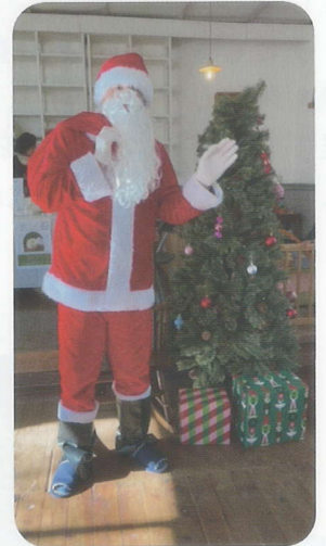
今年もサンタ登場