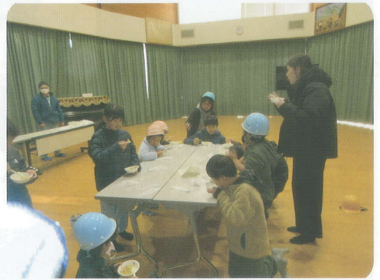
アルファ化米を試食